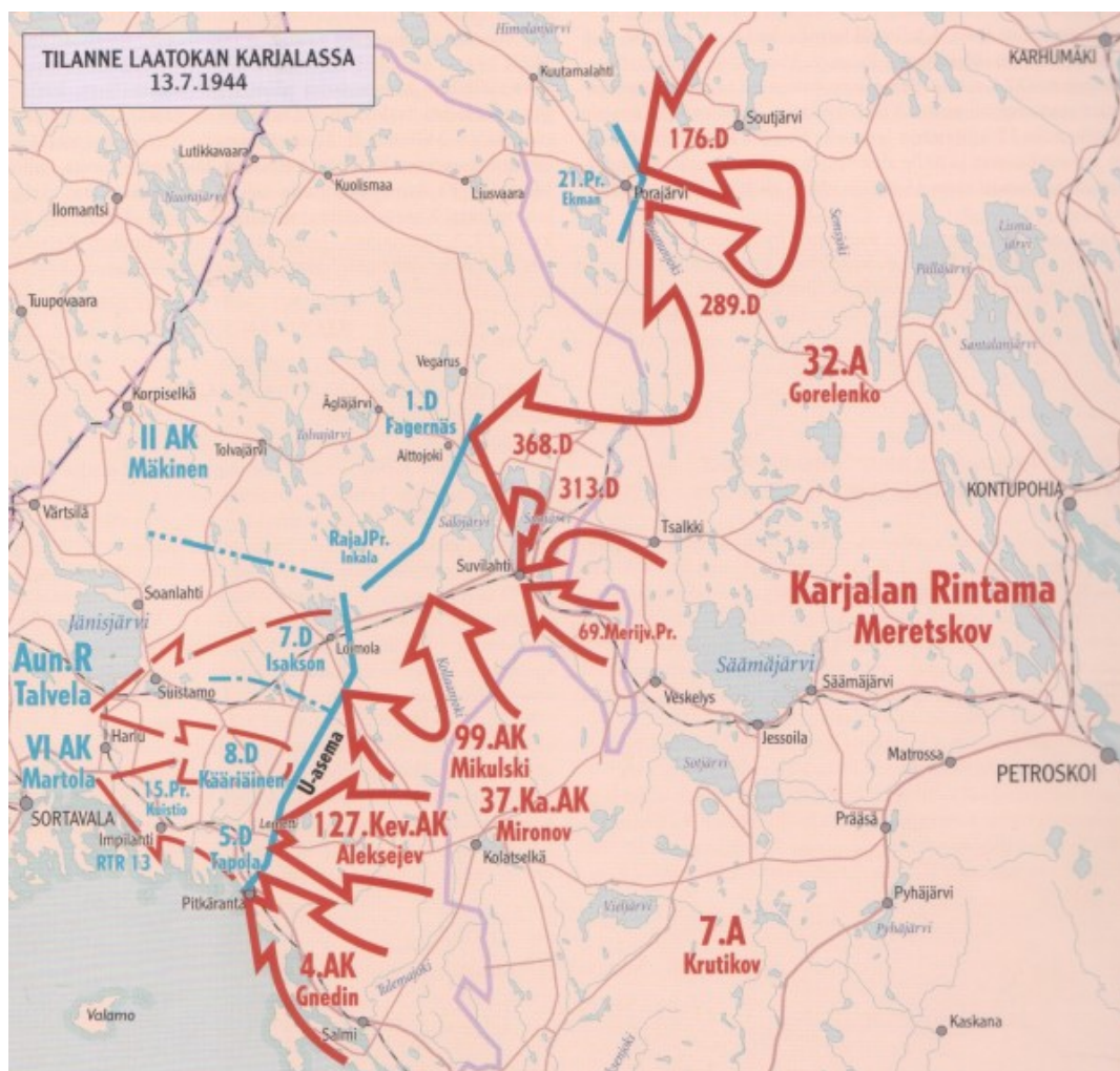
Карта 1.

7-я пехотная дивизия, оборонявшаяся на направлении Лоймола. В резерве 6-го армейского корпуса в районе Импилахти находилась 15-я пехотная бригада (карта 1).