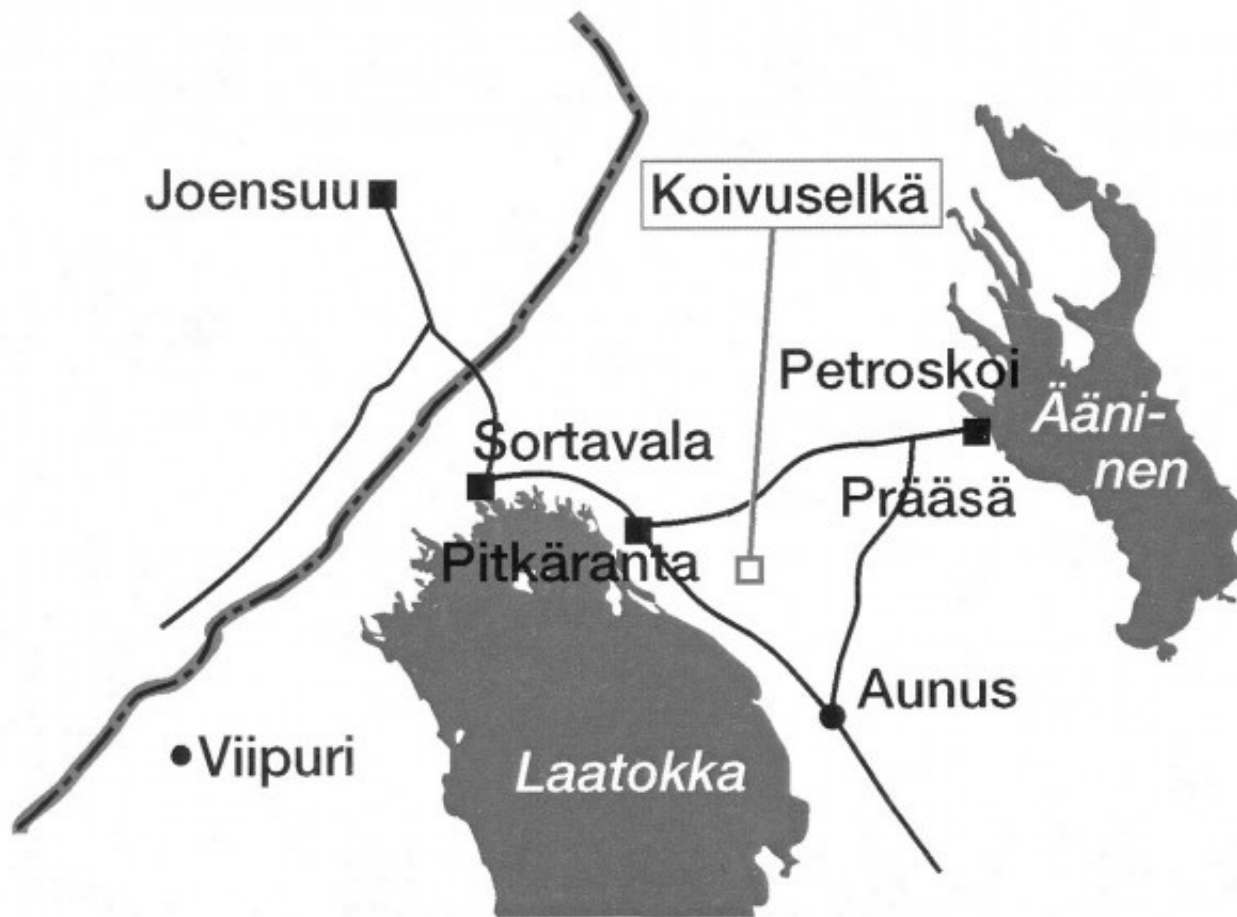
Рис. 1. Поселок Койвусельга (Koivuselkä) Республики Карелия

Поселок Койвусельга расположен в западной части Пряжинского района и находится примерно на одинаковом расстоянии от Петрозаводска и российско-финляндской границы (рис. 1). От шоссейной дороги МАПП Вяртсиля – Петрозаводск поселок отделяет всего 13 километров грунтовой дороги. В середине 1990-х годов мы собрали в Койвусельге большой объем исследовательских материалов, на основе которого был опубликован ряд научных работ, в которых проанализирован менявшийся статус Койвусельги в составе лесного комплекса Республики Карелия, изменения в сфере услуг и повседневной жизни и стратегии выживания сельских жителей в переходный период [22, 37, 26]. В июле 2014 года наша финско-российская исследовательская группа вернулась в Койвусельгу с целью актуализации и получения дополнительных данных о развитии поселка для выявления изменений за последние 20 лет.