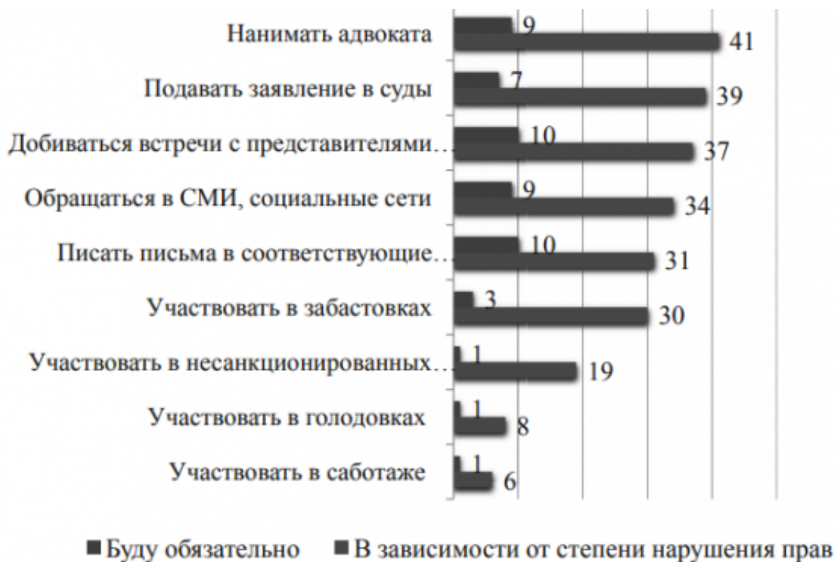
Рис. 2. Распределение ответов респондентов на вопрос «Считаете ли Вы возможным для себя предпринимать следующие действия в случаях отсутствия возможности голосовать, отстаивать свое политическое мнение, нарушения прав человека», июнь 2020 г. в %

В апреле 2020 года, по данным ГНУ Института социологии, ситуация в стране оценивалась респондентами как напряженная – 12,9 % и скорее напряженная, в то время как стабильную или скорее стабильную ее характеризовало 30 % респондентов (5).