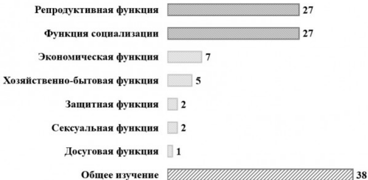
Рис. 3. Распределение количества исследований по изучаемым функциям семьи Fig. 3. Distribution of the number of studies by the family functions studied

Мы можем видеть, суммируя все оставшиеся статьи, что к общему изучению относится около трети всех работ, что, с одной стороны, говорит о приоритете изучения конкретных функций семьи, с другой – о немалом весе статей, посвященных периферийным темам.