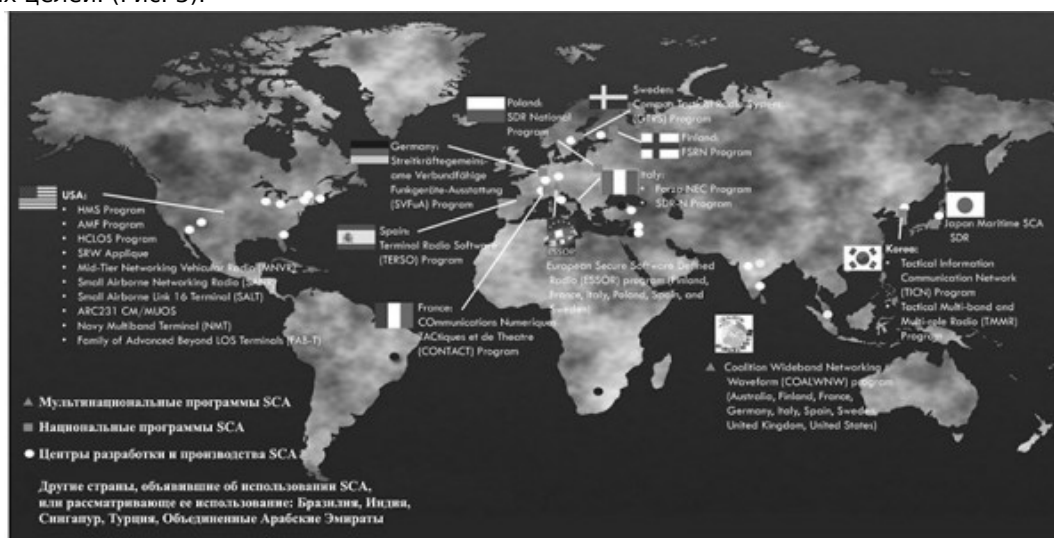
Рис. 3. [18].

Кроме того, с 2007 г. правительство Финляндии наряду с правительствами Франции, Швеции и Польши занимает важную позицию в числе спонсоров проекта ESSOR [10] (Программа Европейского защищенного программно-определяемого радио), который разрабатывается национальными ТНК, в частности Elektrobitt (Финляндия), SAAB (Швеция), Thales Communications & Security (Франция) по заказу Организации управления совместными программами военной техники (фр. OCCAR – Organisation conjointe de cooperation en matiere d'armement) — ключевой структуры в области вооружений ЕС, действующая от имени Агентства поддержки НАТО (NSPA). Программа нацелена на стандартизацию производства программируемых радиосистем в Европе путем использования архитектуры ESSOR для военных целей. (Рис. 3).